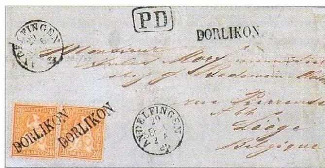
Abb. 4. 1865. Brief mit Stabstempeln DORLIKON nach Belgien.

Un événement analogue avait eu lieu quelques années auparavant concernant le village de Dorlikon (ZH). Ici aussi, on en avait marre avec ce nom. Au 19 e siècle, il était d'usage dans la campagne zurichoise de dire de quelqu'un qui se comportait mal, ou de manière gênante, non pas qu'il était maladroit, mais «qu'il venait de Torlikon». Les habitants se fâchèrent que le nom de leur village serve ainsi à décrire des choses ridicules ou des inepties. En 1877, le nom fut modifié en «Thalheim an der Thur».