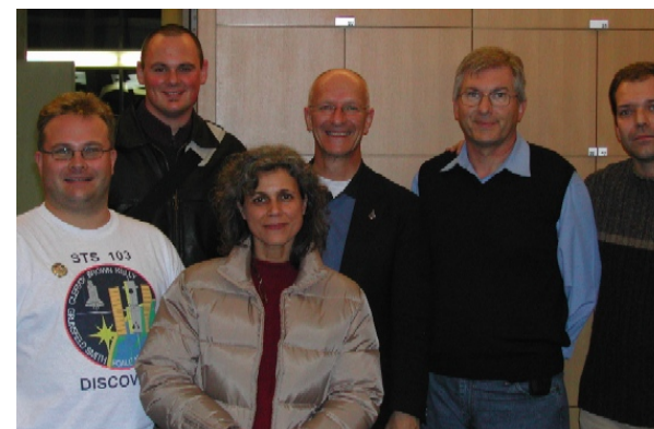
Claude Nicollier (Mitte) mit Mitgliedern unseres Vereins

Nach Möglichkeit und Interesse der Mitglieder organisieren wir auch Reisen zu Ausstellungen und Weltraum-Veranstaltungen im In- und Näheren Ausland.